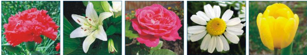
А Б В Г Д

12. Этот цветок считают символом России.