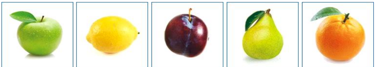
А Б В Г Д