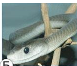
Б ЧЁРНАЯ МАМБА