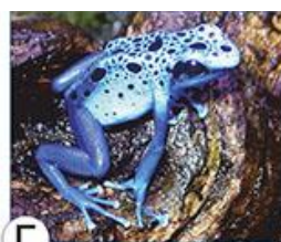
Г ЛЯГУШКА ДРЕВОЛАЗ