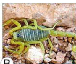
В СКОРПИОН ЛЕЙУРУС