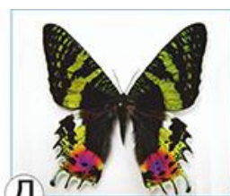
Д БАБОЧКА УРАНИЯ

26. Бернард Гржимек писал, что «это животное — единственный защитник слонов и зебр в тех случаях, когда человек пытается отобрать у них родину».